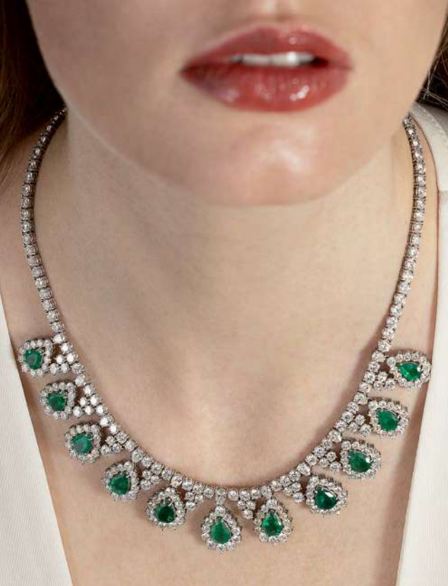
Colier din aur alb pavat cu diamante și smaralde Adjudecat: 28.000 €