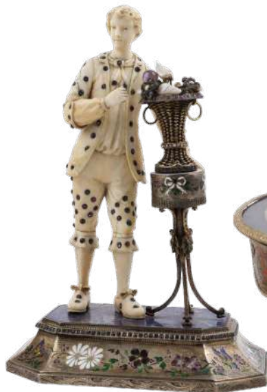
Statuete din fildeș, ornate cu pietre prețioase Adjudecat: 11.000 €