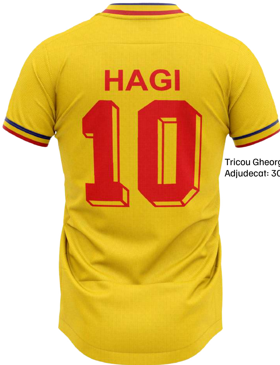
Tricou Gheorghe Hagi Adjudecat: 30.000 €

Recent inaugurata tematică a memorabiliei sportive a marcat la rândul ei un record în 2024, anume vânzarea caritabilă în luna mai a tricoului de joc al lui Gheorghe Hagi , nr. 10, purtat în ultimul meci al „Generației de Aur”, pentru suma celebrantă de 30 de mii de euro ; tot celebrant, amintim și de cea mai bună vânzare, la capitolul vinurilor de colecție, a unei sticle de Chateau Petrus , din 1984, pentru 4 mii de euro !