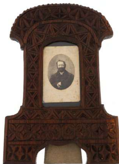
Fotografie înfățișându-l pe Avram Iancu Adjudecat 5.000 €

Menționăm, în primul rând pentru că este într-atât de specific românesc, și excepționala adjudecare a icoanei pe sticlă/glază, piesă de muzeu, „ Isus Hristos și Mare Arhiepiscop, tronând ”, realizată în 1803 de celebrul Prim Atelier de la Nicula , adjudecată pentru 6 mii de euro .