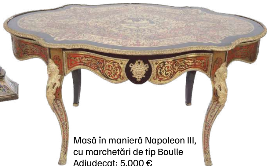
Masă în manieră Napoleon III, cu marchetări de tip Boulle Adjudecat: 5.000 €