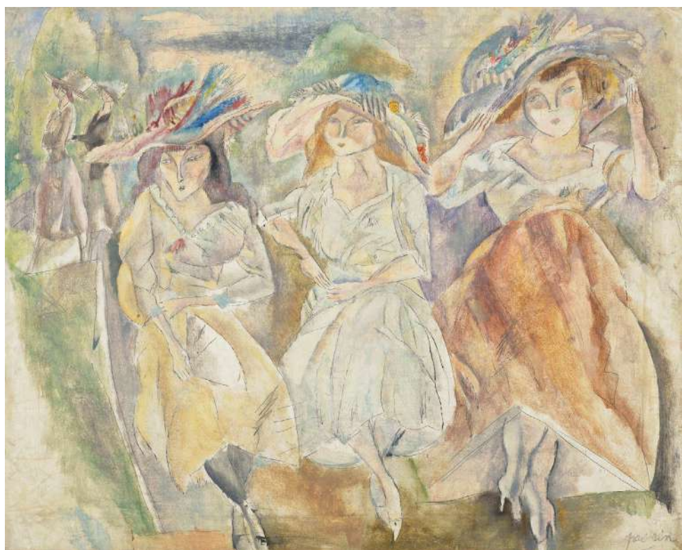
„Hermine David și prietenele” Jules Pascin Adjudecat: 60.000 €

Desigur că aceste recorduri par mici iubitorilor de artă români, acomodați unei piețe cu creșteri regulate, din an în an, pe măsura lărgirii și adâncirii acesteia, însă piețele de artă bulgare și croate și-au început organizarea și ascensiunea recent, de abia doi ani. Suntem convinși că vom vedea în curând semnificative rezultate și recorduri, pe măsura celor înregistrate într-o piață mai evoluată, nu neapărat matură, precum cea românească (ori poloneză, ori ungurească).