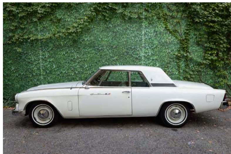
Automobil Studebaker Hawk Grand Turismo Adjudecat: 60.000 €

Nici un an de licitații nu este glorios fără impresionantele vânzări ale licitațiilor de Eleganță, atât feminină, cât și masculină, în cursul lui 2024 punctate de câteva adjudecări interesante, între care menționăm: pe primul loc adjudecarea în decembrie 2024 a senzaționalului ceas Jacob & Co Bugatti Chiron Tourbillon , din aur roz, din 2022-2023, pentru 65 de mii de euro , o oportunitate cum doar licitațiile pot găzdui; apoi cea a excepționalului colier din aur alb, pavat cu diamante și smaralde , tot în decembrie 2024, pentru 28 de mii de euro ; trebuie totodată menționată, pentru semnificația istorică a bijuteriei-artefect, adjudecarea în iunie 2024 a unui inel ce a aparținut Mariei Tănase, din aur decorat cu safir central și diamante, dăruit de Constantin Brâncuși , conform testamentului acesteia, provenind din colecția familiei, cumpărat pentru 11 mii de euro ; la capitolul eleganță masculină reținem și rara ediție Montblanc „Patron of Art” a stiloului Max von Oppenheim , adjudecată pentru 3 mii de euro , precum și, mai ales, adjudecarea remarcabilă a unui rar automobil Studebaker (Hawk Grand Turismo) , fabricat în 1964, pentru suma de 60 de mii de euro .