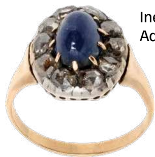
Inelul Mariei Tănase Adjudecat: 11.000 €