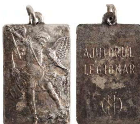
Medalie „Ajutorul legionar”, 1940 Adjudecat: 3.000 €