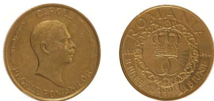
Monedă emisă de Carol al II-lea, 1940 Adjudecat: 32.000 €