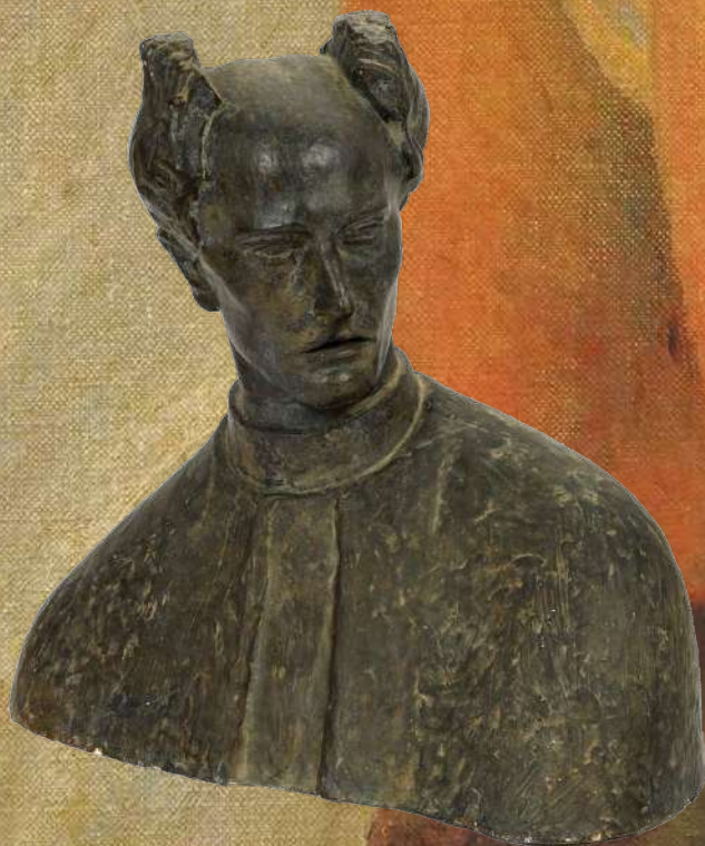
„Bustul lui Josip Juraj Strossmayer” Ivan Meštrović Adjudecat: 32.500 €

Similar, 2024 a fost primul tur complet de licitații de artă croată organizat de Artmark Croația la Zagreb; de fapt, nu doar de artă croată, ci și de artă sârbă, slovenă, bosniacă, muntenegreană etc. – patrimoniul artistic, parțial comun, al pieței de artă croate reunindu-se frecvent în cele 4 licitații principale de artă de la Zagreb. Cu un total de vânzări în 2024 de 1,07 mil. euro și o rată medie anuală de adjudecare de 60,92% (în creștere față de media anuală de 53,63% a anului 2023), și piața de artă croată se înscrie într-un trend regional crescător, de definire, infrastructurare și modernizare.