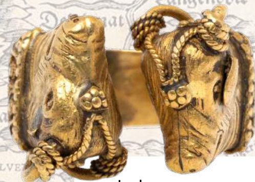
Inel greco-roman Adjudecat: 6.500 €

Mai departe, la categoria antichităților universale, remarcăm în primul rând inedita vânzare (și, asemenea, inedita prezență în piața românească de artă și istorie) a armurii complete de samurai, pentru luptă, din perioada Edo (sec. XVIII), adjudecate pentru 7.500 de euro ; apoi pe cea a inelului greco-roman din aur , decorat cu capete de taur, provenind din perioada Elenistică (sec. IV-III î.Hr.) vândut în licitație pentru 6.500 de euro ; dar și adjudecarea primei și micii hărți „Europa”, realizate de Johann Stumpf , la Zürich în 1562, pentru prețul de 2.250 de euro .