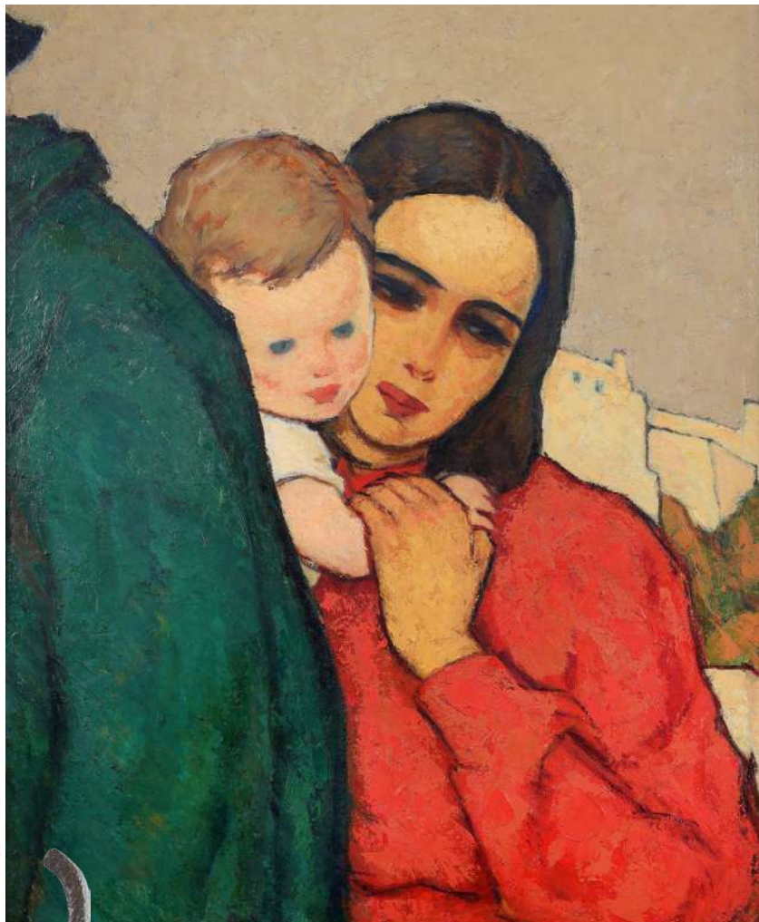
„Maternitatea” Nicolae Tonitza Adjudecat: 200.000 €