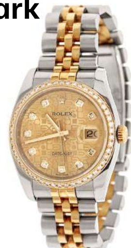
Ceas Rolex Datejust, din aur și oțel, cu diamante Vândut: 11.457 €

2024 s-a arătat prielnic și pentru creșterea volumului de vânzări private/directe/ din magazinul Artmark („Dependent de Artă”) , acesta sporind cu 34,6% , de la 1,08 mil. euro în 2023 la 1,45 mil euro în 2024 ( cel mai mare salt de creștere din 2021 ). Între motivele acestei creșteri spectaculoase, departamentul de vânzări directe al Artmark/ Dependent de Artă enumeră îndeosebi: