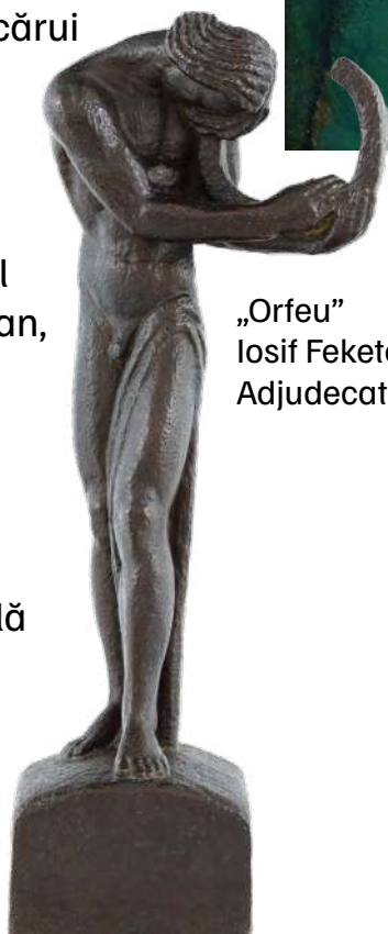
„Orfeu” Iosif Fekete Adjudecat: 18.000 €