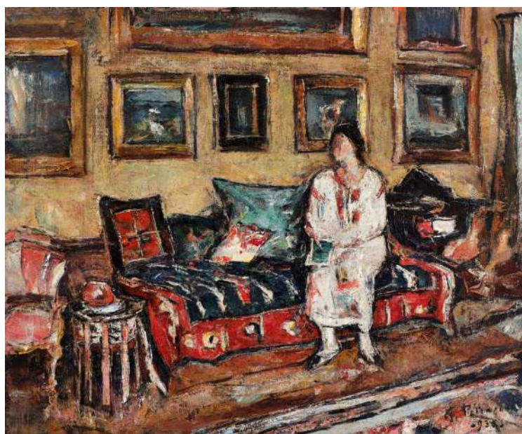
„Lucreția în interior la Târgoviște” Gheorghe Petrașcu Vândut: 35.000 €