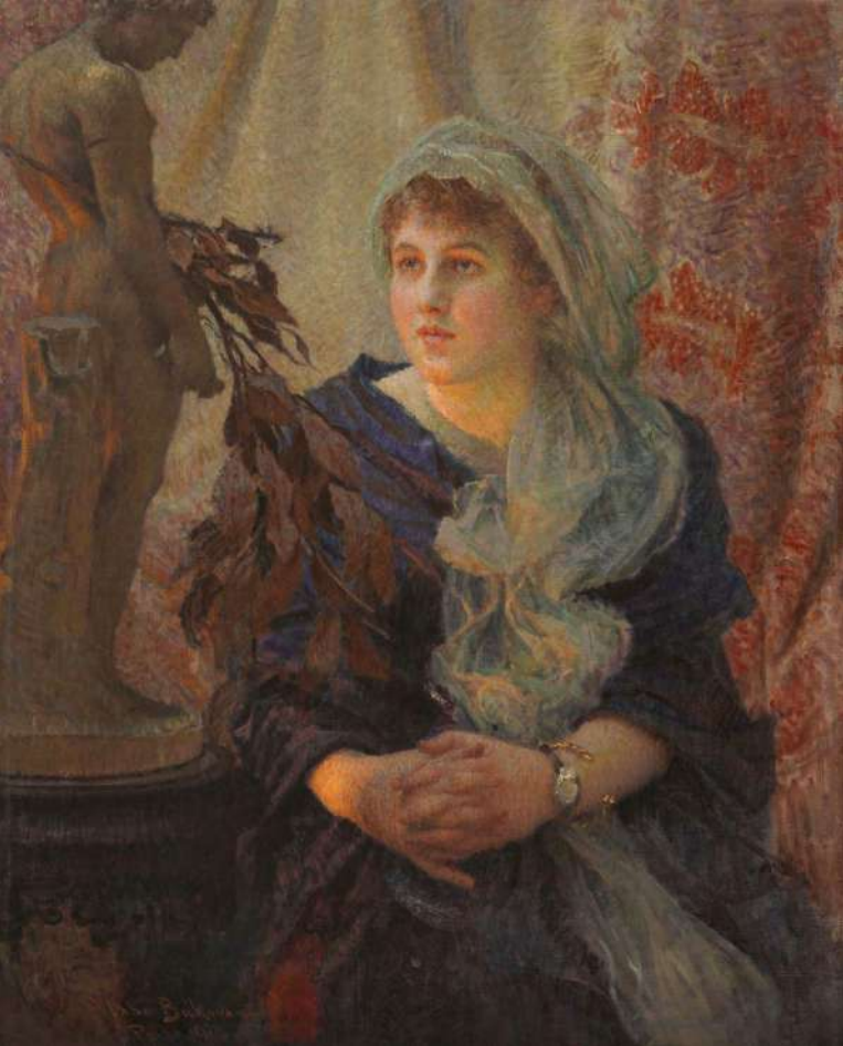
„Frumusețe antică” Vlaho Bukovac Adjudecat: 66.000 €

Totodată, Artmark a marcat, în Licităția Artmark de Toamnă Zagreb, recordul pentru o vânzare croată prin licitație în Croația, adjudecând pentru 66 de mii de euro o importantă pictură de patrimoniu a maestrului Vlaho Bukovac, „ Frumusețe antică ”, din 1915. Câtă vreme, la Sofia, recordul de licitație datează de curând, tot din decembrie, prin adjudecarea pentru 60 de mii de euro a subtilei picturi a maestrului modernist Jules Pascin , „ Hermine David și prietenele ”, din 1917.