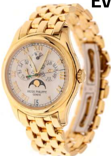
Ceas Patek Philippe Annual Calendar, din aur Vândut: 30.000 €