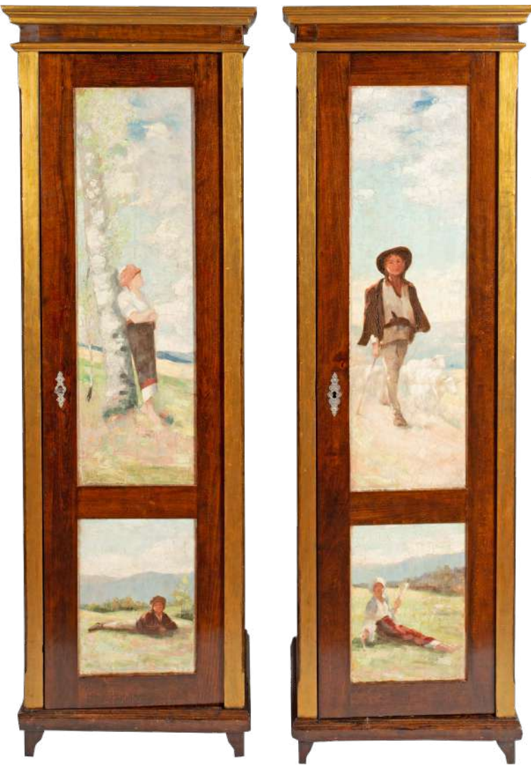
Pereche de dulapuri, integrând panouri pictate, posibil de Nicolae Grigorescu Adjudecat: 10.500 €

Și finalmente, dar nu în ultimul rând, închidem scurta listă a amintirii recordurilor anului 2024 cu nobila secțiune a artei decorative de colecție, a marilor meșteri argintari și ebeniști, fugăr evidențiind câteva piese și cumpărări remarcabile: două mici statuete din fildeș, ornate cu pietre prețioase (safire, rubine, smaralde, perle etc.), probabil realizate pentru familia imperială Habsburgică, adjudecate pentru 11 mii de euro ; o masă de salon în manieră Napoleon III, cu marchetările de tip Boulle, decorată cu scenă mitologică, adjudecată pentru 5 mii de euro ; dar și, odă a simbolisticii naționale, perechea de dulapuri, integrând panouri pictate, posibil de Nicolae Grigorescu, provenind din colecția istorică a savantului Constantin I. Istrati, amic și vecin în Câmpina al pictorului național, adjudecată pentru 10.500 de euro , în octombrie 2024.