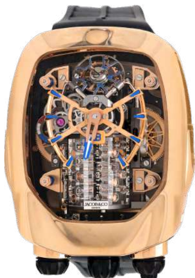
Ceas Jacob & Co Bugatti Chiron Tourbillon Adjudecat: 65.000 €