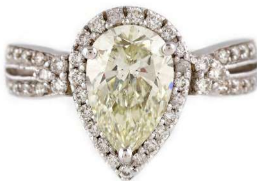
Inel din aur alb, decorat central cu un impozant diamant pear-shaped Vândut: 10.935 €