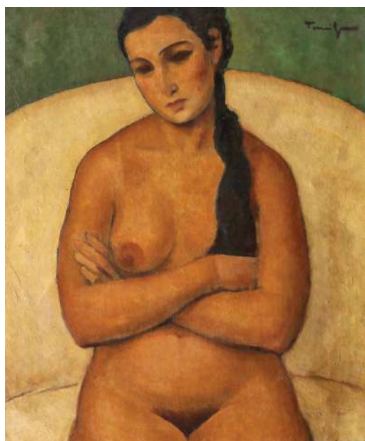
„Nud pe canapea” Nicolae Tonitza Vândut: 80.000 €

b) interesului crescut al pieței, în acest moment recesionar și inflaționist, pentru conservarea valorii banilor în bunuri culturale de marcă.