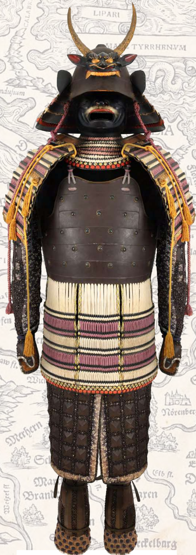
Armură de samurai din perioada Edo Adjudecat: 7.500 €

Mai departe, la categoria antichităților universale, remarcăm în primul rând inedita vânzare (și, asemenea, inedita prezență în piața românească de artă și istorie) a armurii complete de samurai, pentru luptă, din perioada Edo (sec. XVIII), adjudecate pentru 7.500 de euro ; apoi pe cea a inelului greco-roman din aur , decorat cu capete de taur, provenind din perioada Elenistică (sec. IV-III î.Hr.) vândut în licitație pentru 6.500 de euro ; dar și adjudecarea primei și micii hărți „Europa”, realizate de Johann Stumpf , la Zürich în 1562, pentru prețul de 2.250 de euro .