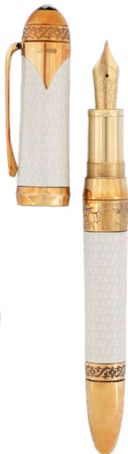
Stilou Max von Oppenheim, ediția „Patron of Art”, Montblanc Adjudecat: 60.000 €