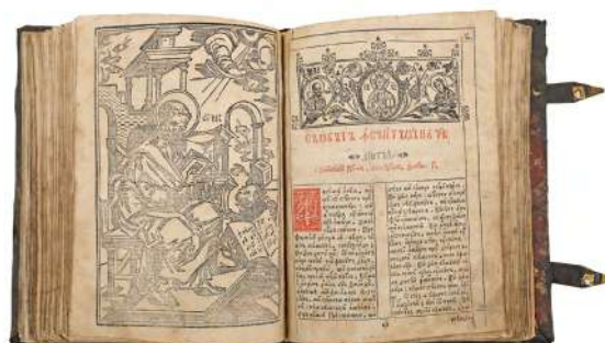
Evanghelia Ștefan Cantacuzino Adjudecat: 7.500 €