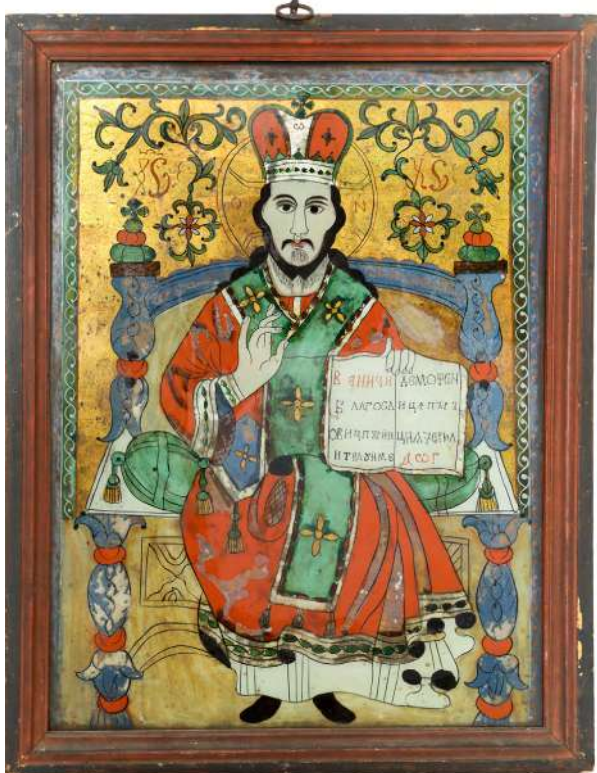
Icoană, „Isus Hristos și Marele Arhiepiscop, tronând” Prim Atelier de la Nicula Adjudecat: 6.000 €

Dintr-aceiași fief de spiritualitate și adresând aceleași puternice intime nevoi de identificare și recuperare istorică vin și pledoariile de piață și adjudecare robustă pentru: fotografia înfățișându-l pe Avram Iancu , din 1865, adjudecată, în martie 2024, pentru 5 mii de euro ; „ Evanghelia ” lui Șerban Cantacuzino , adjudecată în februarie 2024, pentru 7.500 de euro ; mica medalie „ Ajutorul Legionar ” din 1940, adjudecată record în noiembrie 2024 pentru prețul de 3 mii de euro ; dar și, mai ales, rara monedă din 1940, emisă de Carol al II-lea , din aur, de 100 de lei, adjudecată în martie 2024, pentru 32 de mii de euro .